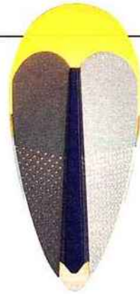
TRIBAL Applique Sorcier métal. H : 46,5 cm. Marta Bakowski. La Chance. 349 €. lightonline.fr