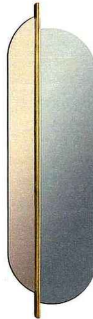
BICOLORE Miroir Totem cuivre, argent. H : 170 cm, L : 47 cm. Red Edition. 1190 €. rededition.com