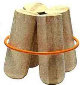
ESSENTIEL Tabouret Bolt en hêtre cerclé de métal. Note Studio. H : 41 cm. La Chance. 568 €. thecoolrepublic.com