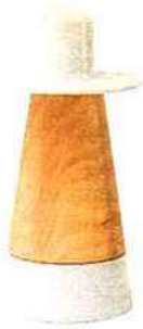
LUDIQUE Lampe cône en grès et bois tourné. H : 29 cm. 170 €. adonde.fr