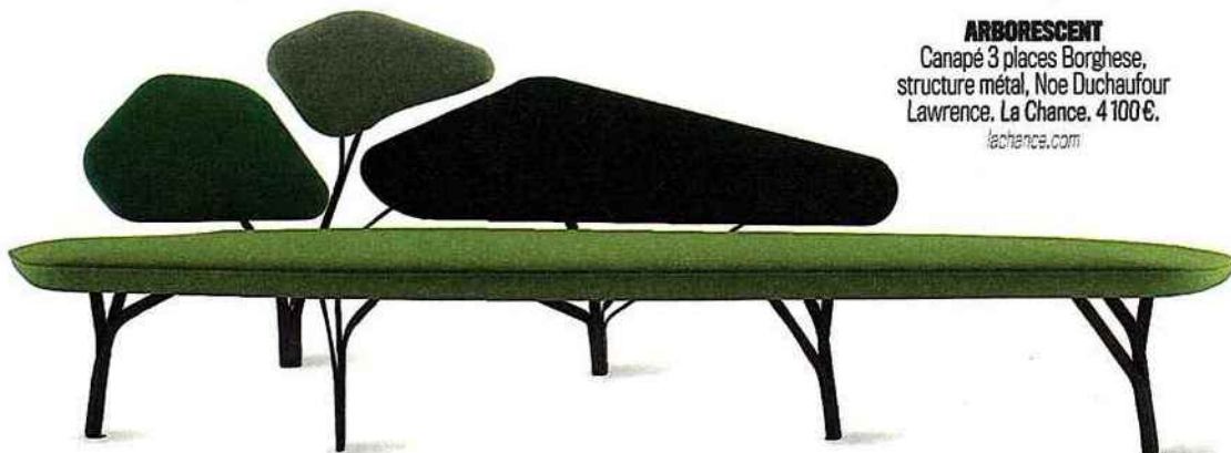
ARBORESCENT Canapé 3 places Borghese, structure métal, Noe Duchaufour Lawrence. La Chance. 4 100 €. lachance.com

Les Français se sont longtemps accrochés à leur mobilier de style avant de s'intéresser au design. Mais tout a changé, à l'aube des années 2000, avec l'engouement pour une déco plus en phase avec les modes de vie contemporains. À côté des grandes enseignes qui dominent le marché de l'ameublement à plus de 50 %, de jeunes maisons d'édition nées il y a moins de dix ans ont investi ce marché florissant. Leur but : mettre en rapport de jeunes designers et des fabricants afin de proposer une offre qui ait du style et se distingue du marché de masse. Ils misent sur une clientèle qui peut très bien s'équiper dans de grandes chaînes de produits standard, mais aussi craquer pour une pièce originale un peu plus chère, comme on le fait désormais dans la mode. Et les propositions sont multiples : formes inédites comme chez La Chance, où l'on valorise la structure comme élément ornemental, mobilier astucieux et coloré et prix raisonnables chez Hartô, Adonde, Enostudio, ou encore les créations artisanales et durables de Dugeot Labo ou d'Alki. Une « french touch » qui s'exporte de mieux en mieux. MYRIAM ANDRÉ