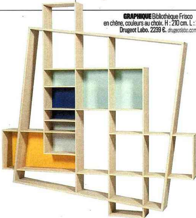
GRAPHIQUE Bibliothèque Frisco en chêne, couleurs au choix. H : 210 cm. L : 201 cm. Drugeot Labo. 2239 €. drugeotlabo.com