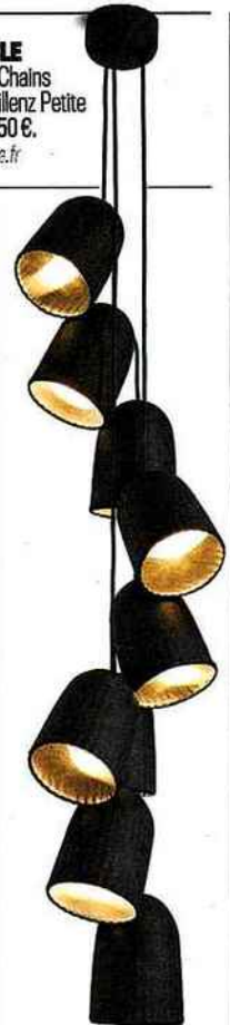
MULTIPLE Suspension Chains Triple, Sylvain Willenz Petite Friture. 1150 €. decodéluxe.fr