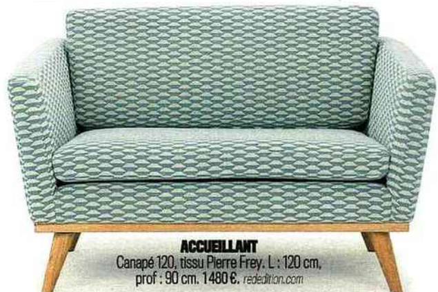
ACCUEILLANT Canapé 120, tissu Pierre Frey. L : 120 cm, prof : 90 cm. 1480 €. rededition.com