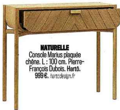
NATURELLE Console Marius plaquée chêne. L : 100 cm. Pierre- François Dubois. Hartò. 999 €. hartodesign.fr